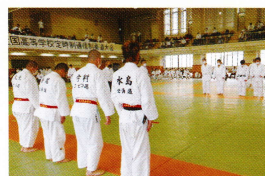
令和4年度全国大会出場 (柔道部)