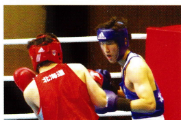
平成30年度高校総体出場 (ボクシング部)