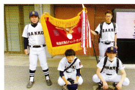
令和4年度全国大会出場 (野球部)