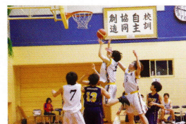
(バスケットボール部)